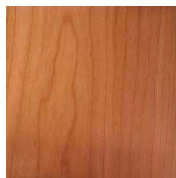
ブラックチェリー

桃色がかった白っぽい褐色か ら、3年ほど経つとオレンジ がかった鉛色になります。